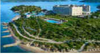
La Blanche Island – Muğla