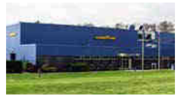
Goodyear – Sakarya