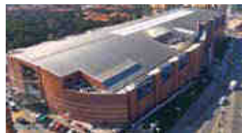
Capitol Avm – İstanbul