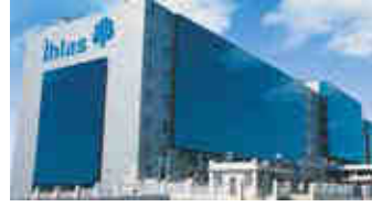
İhlas Holding – İstanbul