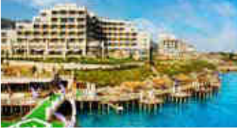
Merit Royal – Kıbrıs