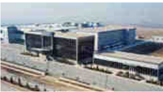
Gen İlaç – Ankara