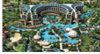
Kaya Otelleri – Kıbrıs, Antalya