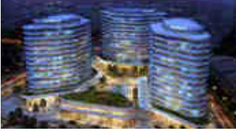
Maidan Tower – Ankara