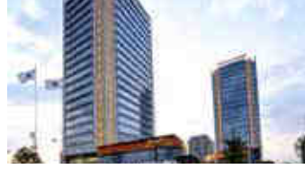
Tepe Prime – Ankara