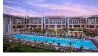
Regnum Carya Golf Resort – Antalya