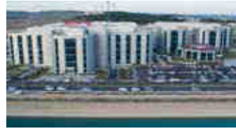
Harran Üniversitesi Araştırma ve Uygulama Hastanesi – Şanlıurfa