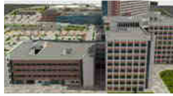
Mardin 300 Yataklı Devlet Hastanesi Mardin