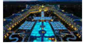
Babylon Limak – Kıbrıs