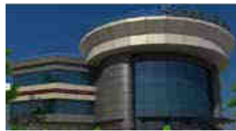
Saadet Gıda – Ukrayna, Türkiye