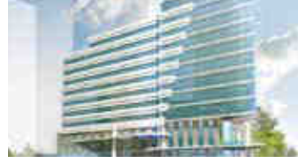
Dedeman Park Levent – İstanbul