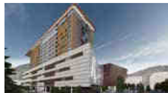
Rize Avm – Rize