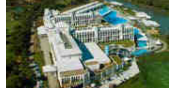
Titanic Deluxe Belek – Antalya