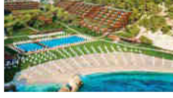
Maxx Royal Kemer – Antalya