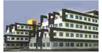
Gaziantep Üniversitesi Tıp Fakültesi Gaziantep