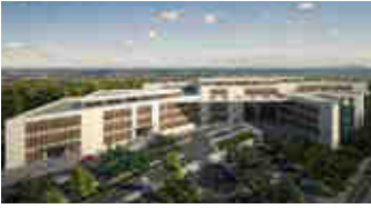
Ceyhan 250 Yataklı Devlet Hastanesi – Adana