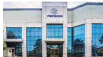
Pepsico Fritolay – İstanbul, Mersin