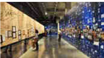
İstanbul Modern Müze – İstanbul