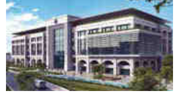
Bağcılar Belediye Binası – İstanbul