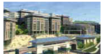
Bezmialem Üniversitesi – İstanbul

Eski Büyükdere Cad. Sümer Sokak No:1B Ayazağa Ticaret Merkezi Kat:16 Maslak 34398 İstanbul T: 0212 286 18 38 E: merkeziklima@formgroup.com www.formmerzekiklima.com www.formgroup.com